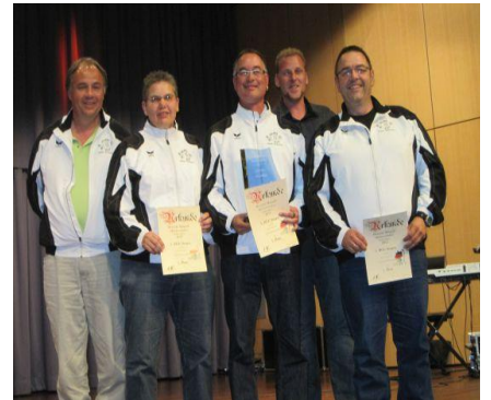
1.BGC Singen e.V. Deutscher Mannschaftsmeister 2011 und 2012