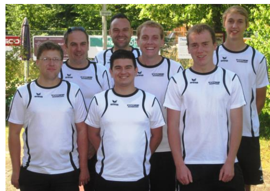
Herrenmannschaft 2015 Bundesliga Süd