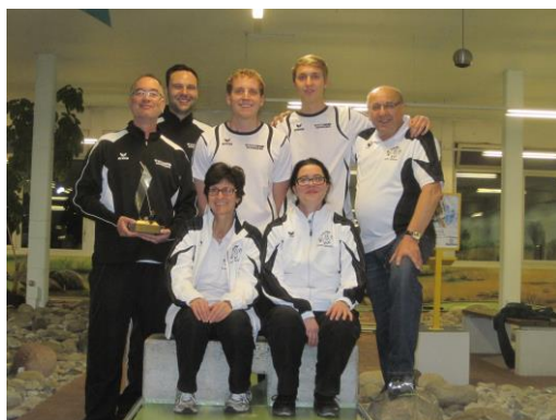
1.BGC Singen e.V. Schweizermeister 2012/2013/2014