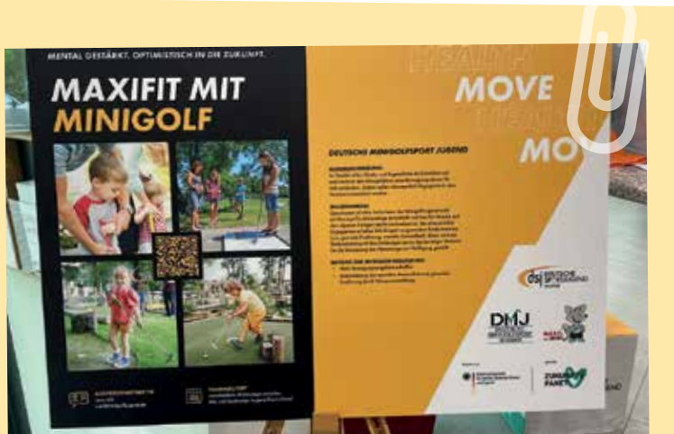
MAXIfit mit MINIfolf war Tagesordnungspunkt auf der Fachtagung

Nach intensiven und lehrreichen zwei Tagen lässt sich sagen, dass die Deutsche Minigolfsport Jugend mit MAXIfit mit MINIfolf schon auf dem richtigen Weg ist, um Kinder und Jugendliche zu stärken und fit zu machen. Gemeinsam mit den Vereinen werden wir in diesem Jahr viele Kinder bewegen und somit einen Beitrag zu ihrer Gesundheit leisten.