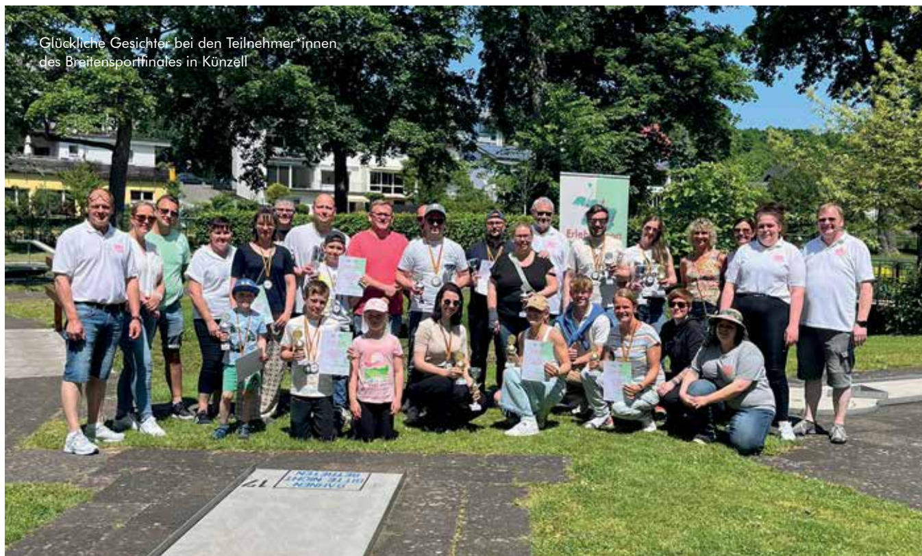
Glückliche Gesichter bei den Teilnehmer*innen des Breitensportfinales in Künzell