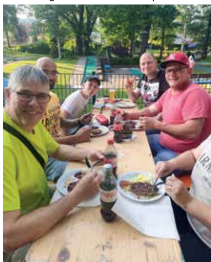
Die Stimmung der Teilnehmer*innen am Grillabend war sichtlich gelöst.