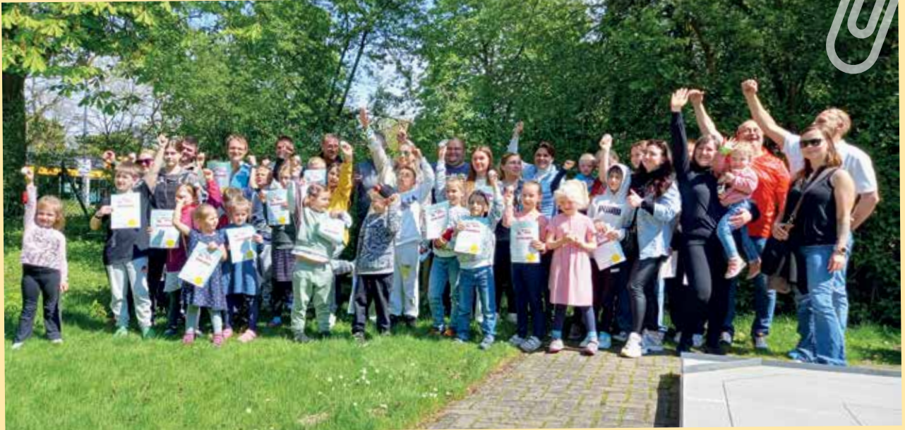
Strahlende Gesichter beim Auftakt der „MAXIfit mit MINIfolf“-Events in Bremen

Am 1. Mai hat der BGC Bremen Kinder und Jugendliche zur Veranstaltung MAXIfit mit MINIfolf eingeladen. Der Verein aus der Hansestadt hat damit den Startschuss für die Events im Rahmen der Kampagne gegeben. Ein ganz besonderer Tag sollte dies für knapp 30 ukrainische Kinder werden, die der Krieg aus ihrem Heimatland vertrieben hat.