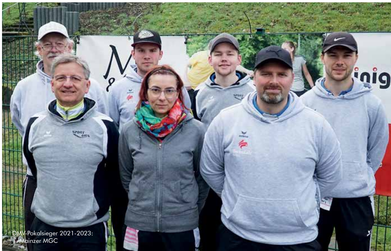
DMV-Pokalsieger 2021-2023: 1. Mainzer MGC