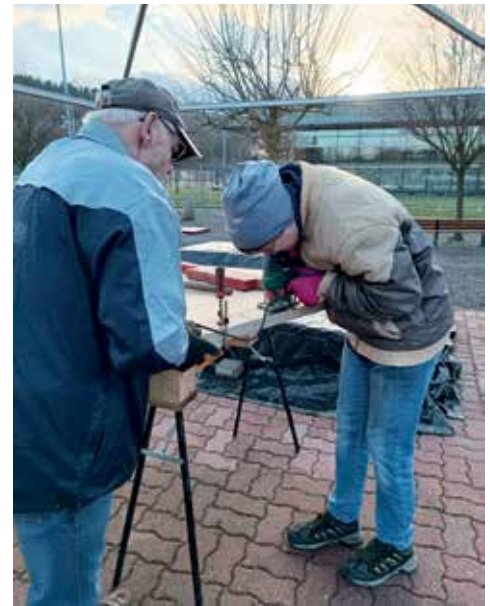
Bei den Montagearbeiten

Bis Ostern konnte in 200 freiwilligen Stunden durch die Abteilungsmitglieder und Freunde auf der Anlage die Hälfte der Bahnen für das Bekleben mit Filz montiert werden. Dazu waren Arbeiten wie der Abbau und Abtransport der alten Bahnen, das Montieren der Rahmenelemente, das Nivellieren der Bahnen, das Befestigen der Siebdruckplatten und Anfertigen der Hindernisse nötig. Die alten Bahnen wurden an zwei in städtischer Trägerschaft befindliche Schulen und an einen Gartenverein in Flöha verteilt, die diese für Freizeit-zwecke nachnutzen wollen. Für die Tage nach Ostern war die Hoffnung groß, die Filzklebearbeiten unter passenden Außentemperaturen durchzuführen. Mit gleichem Aufwand, aber gesammelten Erfahrungen ging es an die zweite Hälfte des Umrüstungsprojektes heran, um die Fertigstellung bis Ende Mai einzuhalten.