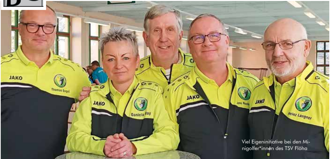
Viel Eigeninitiative bei den Minigolfer*innen des TSV Flöha