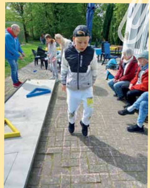
Die „Hüpfkasten“-Station an den Pyramiden

An einer anderen Bahn musste die klassische „Strafrunde“ gedreht werden, wenn der Ball nicht auf Antrieb versenkt wurde. Dieser Wechsel von rasanter Bewegung und konzentriertem Minigolf macht die Kinder nicht nur physisch fit, sondern unterstützt auch die mentale Gesundheit, da sie unter anderem lernen,