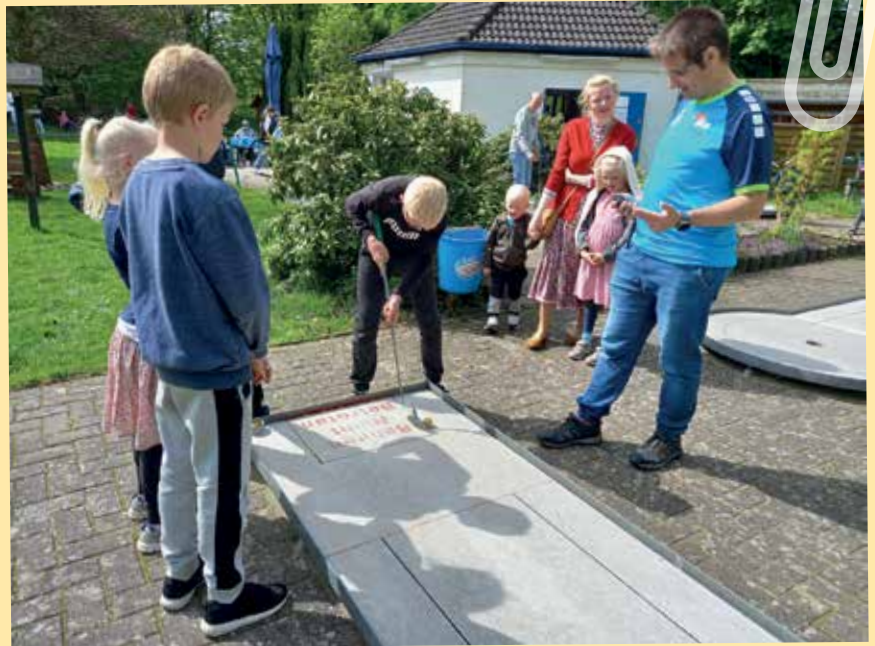
Auch an der Bahn waren die Teilnehmer*innen eifrig dabei