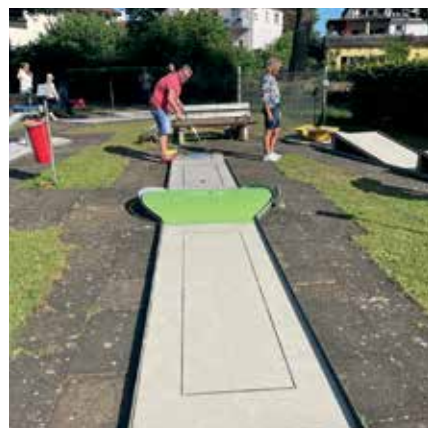
Alle Teilnehmer*innen zeigten tolle Leistungen