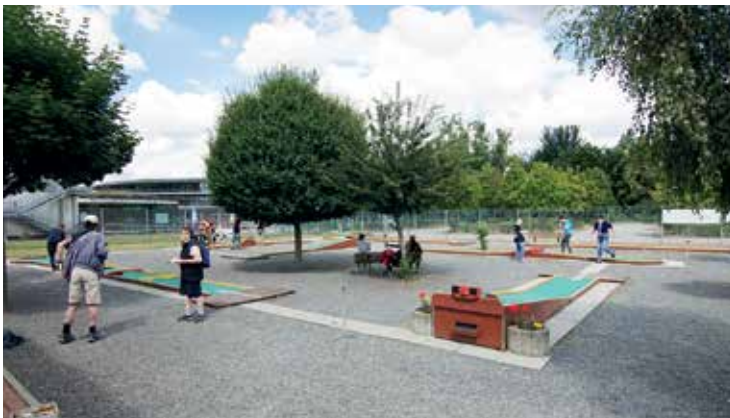
Blick auf die Filzgolfanlage in Flöha

Auch die Abteilung Minigolf belebte die Anlage regelmäßig mit Trophy- und Welcome-Turnieren, wie zum Beispiel den gern besuchten Familien-Cups oder dem „Zwei Flüsse Cup“ immer Anfang Oktober. Es fand ebenfalls 2010 ein Ost-Pokalturnier des Deutschen Minigolfsport Verbandes (DMV) und 2013 ein Bundesligaspieltag auf ihr statt.