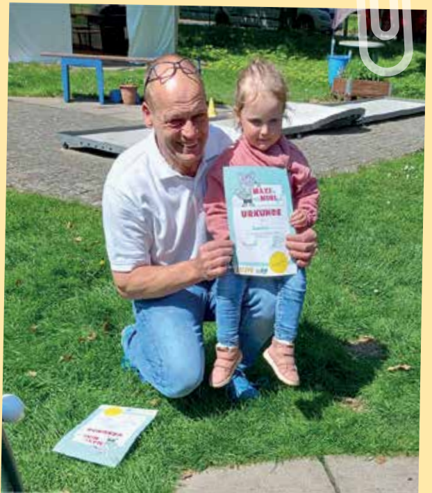
Alle Teilnehmer*innen bekamen eine Urkunde und ein Giveaway