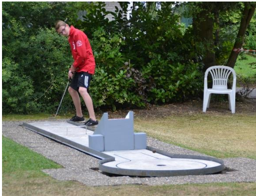
Unsere wohl schwierigste Bahn: die Treppe

Wir haben alle Bahnen gekärchert und geschliffen und sämtliche Markierungen erneuert, so dass sich die Anlage sehr gut spielen lässt, obwohl die Platten jetzt schon fast 50 Jahre alt sind. Wie alle Stammgäste wissen, liegen die Bahnen fast vollständig im Schatten, so dass es nie unangenehm heiß werden kann.