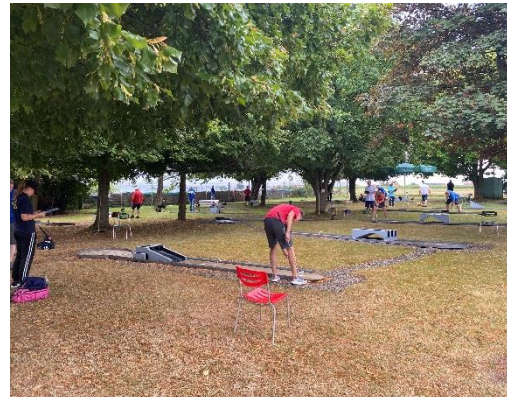
Blick auf die Bahn 18 (und in den „Wald“)

Daher würden wir uns freuen, wenn ihr Euch den Termin freihalten könntet.