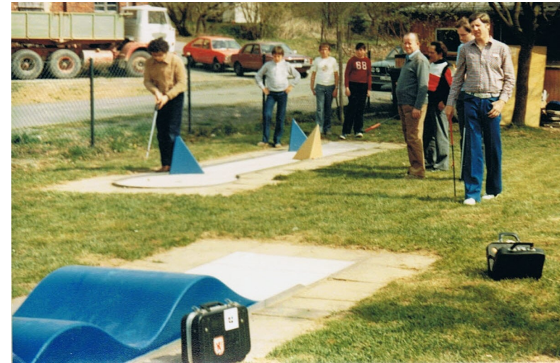
Minigolfanlage Biskirchen 1984