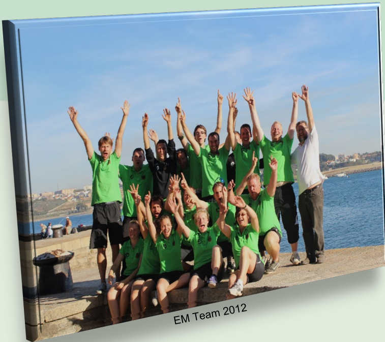
EM Team 2012