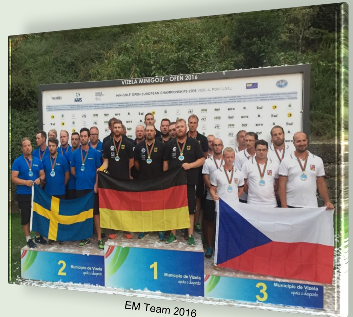
EM Team 2016