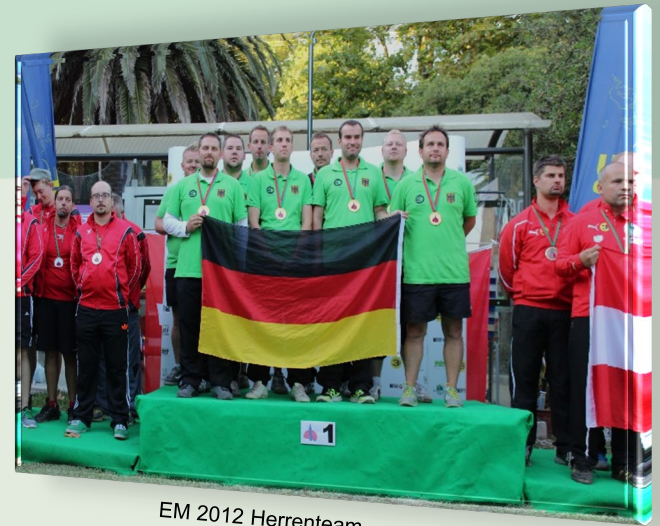
EM 2012 Herrenteam