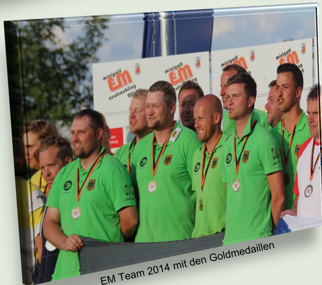
EM Team 2014 mit den Goldmedaillen