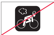
Kein Einfügen oder Verändern von Bestandteilen, z. B. Graphiken, Logo, Text, etc.